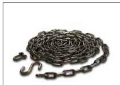
Rozsdamentes acél kiemelő lánc seklivel és S kampóval