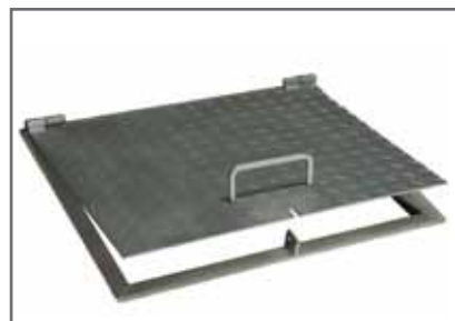
Rozsdamentes acél, zárható akna fedlap, lépésálló 500 x 700 mm