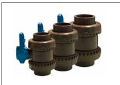
PVC hollandis golyóscsap KK- v. BB-1¼", 1½", és 2" csatlakozással