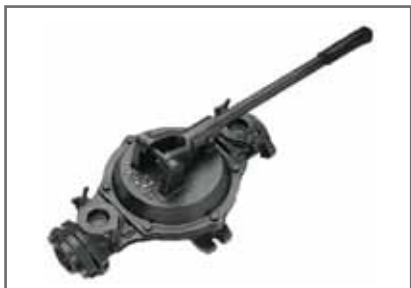
Kézi membránszivattyú beltéri átemelő tartályának kézi üritésére DN50