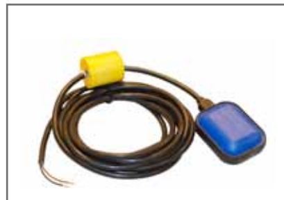
Úszós szintkapcsoló, feszítősúlyal