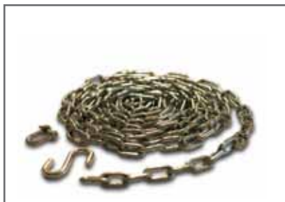
Horganyzott kiemelő lánc seklivel és S kampóval