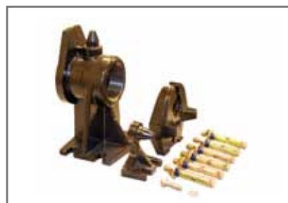
DR1 talpdom és beépítési készlet nedves fix installációhoz