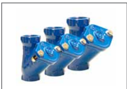
Golyós visszacsapó szelep, BB-1¼", 1½", és 2" csatlakozással