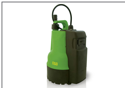
Elektr. zomszivattyú, átemelő géptér víztelenítésére, rejtett szintkapcsolóval, visszafolyásgátlóval