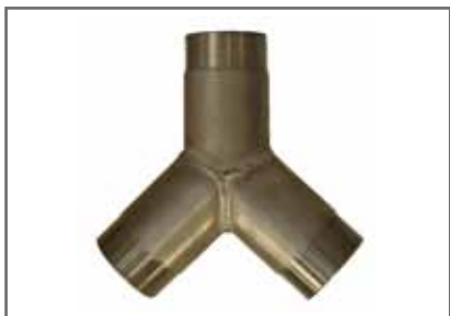
Nyomócső egyesítő „nadrág” idom 3 x 2" KK, rozsdamentes acél