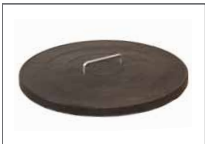
Műanyag aknafedlap, lépésálló Ø 630 mm