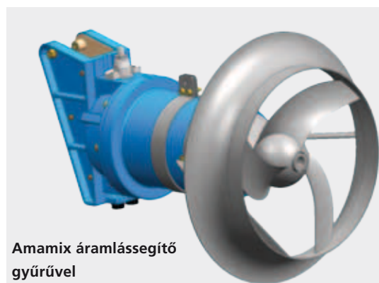
Amamix áramlássegítő gyűrűvel