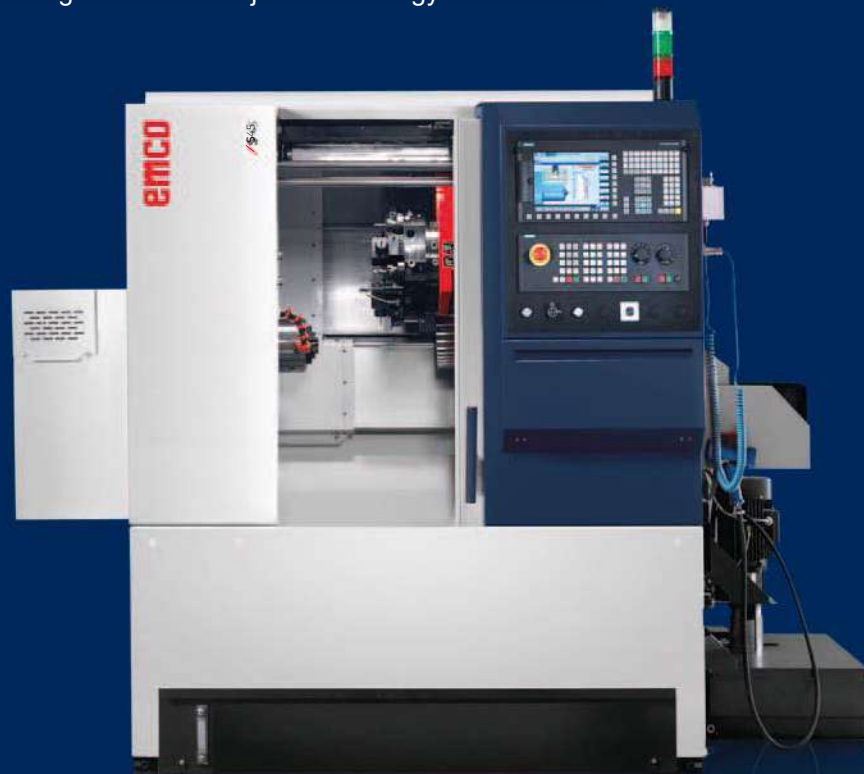
Gép opcionális felszereltséggel

Kompakt CNC-esztergagép fix és meghajtott szerszámok fogadására alkalmas szerszám-váltóval akár \varnothing 45 mm-es rúdanyagok és max. 220 mm átmérőjű tárcsa jellegű alkatrészek megmunkálásához. Nagy teljesítményű főorsó 6300 ford./perc-es maximális fordulatszámmal és 11 kW teljesítményű hajtással. Tengelyek megmunkálásához programozható szegnyereggel is rendelhető. Optimálisan kialakított kapcsolódási lehetőségekkel az automatizálás felé, a legjobb megoldásokat kínálja kis szériás gyártásokhoz is.