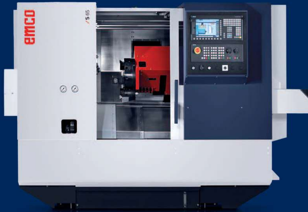
Gép opcionális felszereltséggel

Kompakt CNC-esztergagép fix és meghajtott szerszámok fogadására alkalmas szerszámváltóval akár \varnothing 65 mm-es rúdanyagok és max. 310 mm átmérőjű tárcsa jellegű alkatrészek megmunkálásához. Nagy teljesítményű főorsó 4200 ford./perc-es maximális fordulatszámmal és 18 kW teljesítményű hajtással. Tengelyek megmunkálásához programozható szegnyereggel is rendelhető. Optimálisan kialakított kapcsolódási lehetőségekkel az automatizálás felé, a legjobb megoldásokat kínálja kis szériás gyártásokhoz is.