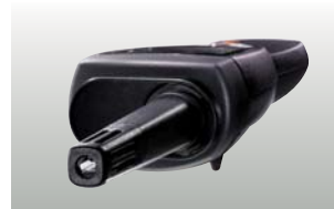
testo 625 csatlakoztatott érzékelőfejjel