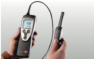
Pára érzékelőfej fogantyúval és érzékelővezetéssel