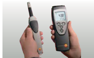
testo 625 fogantyúval és rádiófrekvenciás modulal