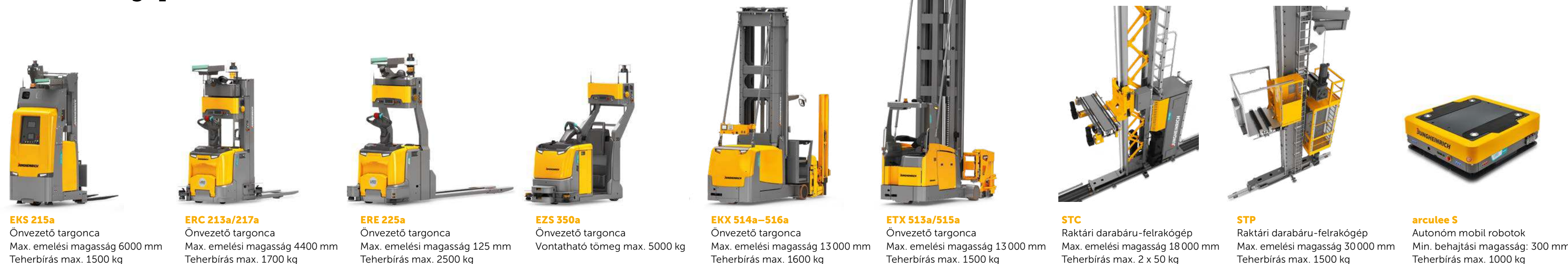
EKS 215a Onvezető targonca Max. emelési magasság 6000 mm Teherbírás max. 1500 kg ERC 213a/217a Onvezető targonca Max. emelési magasság 4400 mm Teherbírás max. 1700 kg ERE 225a Onvezető targonca Max. emelési magasság 125 mm Teherbírás max. 2500 kg EZS 350a Onvezető targonca Vontatható tömeg max. 5000 kg EKX 514a-516a Onvezető targonca Max. emelési magasság 13 000 mm Teherbírás max. 1600 kg ETX 513a/515a Onvezető targonca Max. emelési magasság 13 000 mm Teherbírás max. 1500 kg STC Raktári darabárú-felrakógép Max. emelési magasság 18 000 mm Teherbírás max. 2 x 50 kg STP Raktári darabárú-felrakógép Max. emelési magasság 30 000 mm Teherbírás max. 1500 kg arculee S Autonóm mobil robotok Min. behajtási magasság: 300 mm Teherbírás max. 1000 kg UPC Under Pallet Carrier Teherbírás max. 1500 kg