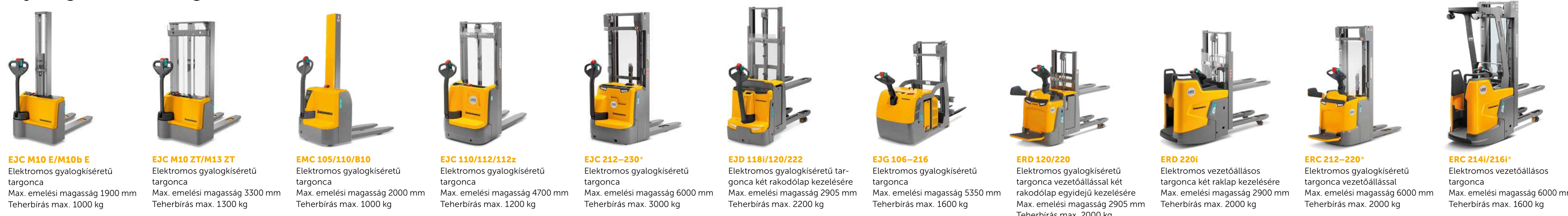
E3C M10 E/M10b E Elektromos gyalogkísérő targonca Max. emelési magasság 1900 mm Teherbírás max. 1000 kg E3C M10 ZT/M13 ZT Elektromos gyalogkísérő targonca Max. emelési magasság 3300 mm Teherbírás max. 1300 kg EMC 105/110/810 Elektromos gyalogkísérő targonca Max. emelési magasság 2000 mm Teherbírás max. 1000 kg E3C 110/112/112z Elektromos gyalogkísérő targonca Max. emelési magasság 4700 mm Teherbírás max. 1200 kg E3C 212-230* Elektromos gyalogkísérő targonca Max. emelési magasság 6000 mm Teherbírás max. 3000 kg E3D 118i/120/222 Elektromos gyalogkísérő targonca két rakodólap kezelésére Max. emelési magasság 2905 mm Teherbírás max. 2200 kg E3G 106-216 Elektromos gyalogkísérő targonca Max. emelési magasság 5350 mm Teherbírás max. 1600 kg ERD 120/220 Elektromos gyalogkísérő targonca vezetőállással két rakodólap egyidejű kezelésére Max. emelési magasság 2905 mm Teherbírás max. 2000 kg ERD 220i Elektromos vezetőállással targonca két raklap kezelésére Max. emelési magasság 2900 mm Teherbírás max. 2000 kg ERC 212-220* Elektromos gyalogkísérő targonca vezetőállással Max. emelési magasság 6000 mm Teherbírás max. 2000 kg ERC 214/216i* Elektromos vezetőállással targonca Max. emelési magasság 6000 mm Teherbírás max. 1600 kg