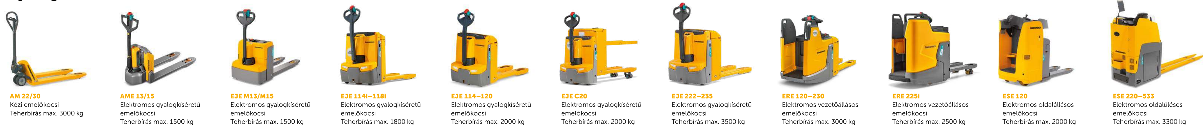
AM 22/30 Kézi emelőkocsi Teherbírás max. 3000 kg AME 13/15 Elektromos gyalogkísérő emelőkocsi Teherbírás max. 1500 kg EJE M13/M15 Elektromos gyalogkísérő emelőkocsi Teherbírás max. 1500 kg EJE 114i-118i Elektromos gyalogkísérő emelőkocsi Teherbírás max. 1800 kg EJE 114-120 Elektromos gyalogkísérő emelőkocsi Teherbírás max. 2000 kg EJE C20 Elektromos gyalogkísérő emelőkocsi Teherbírás max. 2000 kg EJE 222-235 Elektromos gyalogkísérő emelőkocsi Teherbírás max. 3500 kg ERE 120-230 Elektromos vezetőállással emelőkocsi Teherbírás max. 3000 kg ERE 225i Elektromos vezetőállással emelőkocsi Teherbírás max. 2500 kg ESE 120 Elektromos oldalállással emelőkocsi Teherbírás max. 2000 kg ESE 220-533 Elektromos oldalállással emelőkocsi Teherbírás max. 3300 kg