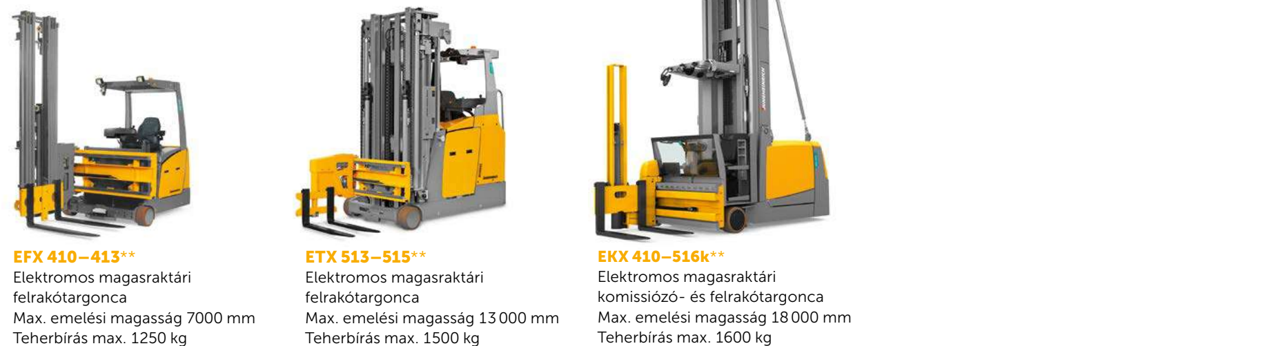
EFY 410-413** Elektromos magasraktári felrakótargonca Max. emelési magasság 7000 mm Teherbírás max. 1250 kg ETX 513-515** Elektromos magasraktári felrakótargonca Max. emelési magasság 13 000 mm Teherbírás max. 1500 kg EKY 410-516k** Elektromos magasraktári kommissiózó- és felrakótargonca Max. emelési magasság 18 000 mm Teherbírás max. 1600 kg