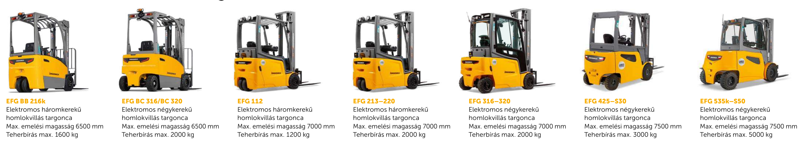
EFB BB 216k Elektromos háromkerékű homlokivillás targonca Max. emelési magasság 6500 mm Teherbírás max. 1600 kg EFB BC 316/BC 320 Elektromos négykerékű homlokivillás targonca Max. emelési magasság 6500 mm Teherbírás max. 2000 kg EFB 112 Elektromos háromkerékű homlokivillás targonca Max. emelési magasság 7000 mm Teherbírás max. 1200 kg EFB 213-220 Elektromos háromkerékű homlokivillás targonca Max. emelési magasság 7000 mm Teherbírás max. 2000 kg EFB 316-320 Elektromos négykerékű homlokivillás targonca Max. emelési magasság 7000 mm Teherbírás max. 2000 kg EFB 425-530 Elektromos négykerékű homlokivillás targonca Max. emelési magasság 7500 mm Teherbírás max. 3000 kg EFB 535k-550 Elektromos négykerékű homlokivillás targonca Max. emelési magasság 7500 mm Teherbírás max. 5000 kg