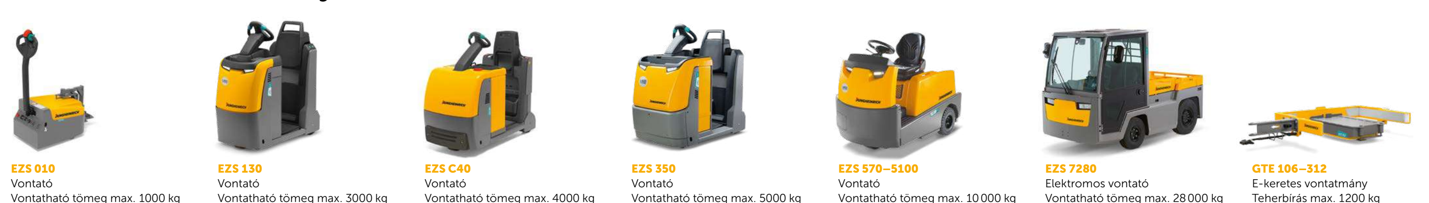
EZS 010 Vontató Vontatható tömeg max. 1000 kg EZS 130 Vontató Vontatható tömeg max. 3000 kg EZS C40 Vontató Vontatható tömeg max. 4000 kg EZS 350 Vontató Vontatható tömeg max. 5000 kg EZS 570-5100 Vontató Vontatható tömeg max. 10 000 kg EZS 7280 Elektromos vontató Vontatható tömeg max. 28 000 kg GTE 106-312 E-keretes vontatmány Teherbírás max. 1200 kg