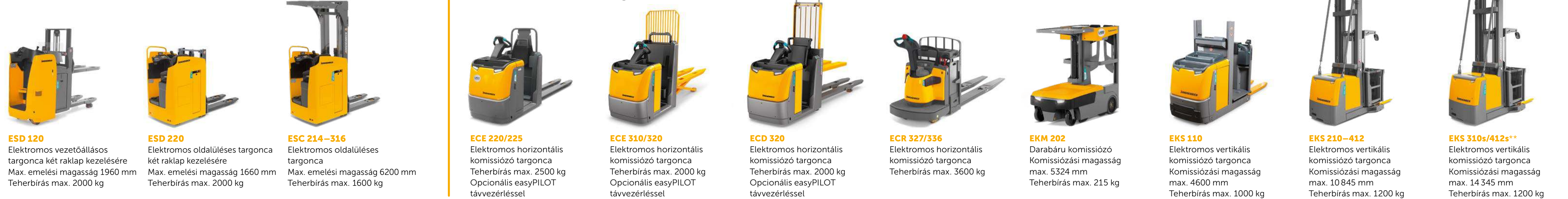
ESD 120 Elektromos vezetőállással targonca két raklap kezelésére Max. emelési magasság 1960 mm Teherbírás max. 2000 kg ESD 220 Elektromos oldalállással targonca két raklap kezelésére Max. emelési magasság 1660 mm Teherbírás max. 2000 kg ESC 214-316 Elektromos oldalállással targonca Max. emelési magasság 6200 mm Teherbírás max. 1600 kg ECE 220/225 Elektromos horizontális kommissiózó targonca Teherbírás max. 2500 kg Opcionális easyPILOT távvezérléssel ECE 310/320 Elektromos horizontális kommissiózó targonca Teherbírás max. 2000 kg Opcionális easyPILOT távvezérléssel ECD 320 Elektromos horizontális kommissiózó targonca Teherbírás max. 2000 kg Opcionális easyPILOT távvezérléssel ECR 327/336 Elektromos horizontális kommissiózó targonca Teherbírás max. 3600 kg EKM 202 Darabárú kommissiózó targonca Kommissiózási magasság max. 5324 mm Teherbírás max. 215 kg EKS 110 Elektromos vertikális kommissiózó targonca Kommissiózási magasság max. 4600 mm Teherbírás max. 1000 kg EKS 210-412 Elektromos vertikális kommissiózó targonca Kommissiózási magasság max. 10845 mm Teherbírás max. 1200 kg EKS 510s/412s** Elektromos vertikális kommissiózó targonca Kommissiózási magasság max. 14345 mm Teherbírás max. 1200 kg