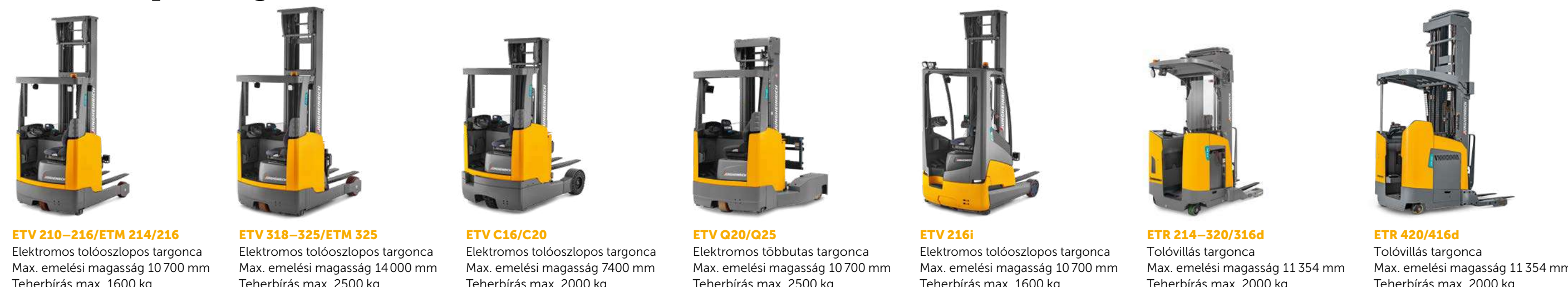
ETV 210-216/ETM 214/216 Elektromos tolóoszlopos targonca Max. emelési magasság 10 700 mm Teherbírás max. 1600 kg ETV 318-325/ETM 325 Elektromos tolóoszlopos targonca Max. emelési magasság 14 000 mm Teherbírás max. 2500 kg ETV C16/C20 Elektromos tolóoszlopos targonca Max. emelési magasság 7400 mm Teherbírás max. 2000 kg ETV Q20/Q25 Elektromos többutas targonca Max. emelési magasság 10 700 mm Teherbírás max. 2500 kg ETV 216i Elektromos tolóoszlopos targonca Max. emelési magasság 10 700 mm Teherbírás max. 1600 kg ETR 214-320/316d Tolóoszlopos targonca Max. emelési magasság 11 354 mm Teherbírás max. 2000 kg ETR 420/416d Tolóoszlopos targonca Max. emelési magasság 11 354 mm Teherbírás max. 2000 kg