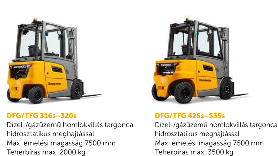
DFG/TFG 316s-320s Dízel-/gázüzemű homlokivillás targonca hidrosztatikus meghajtással Max. emelési magasság 7500 mm Teherbírás max. 2000 kg DFG/TFG 425s-535s Dízel-/gázüzemű homlokivillás targonca hidrosztatikus meghajtással Max. emelési magasság 7500 mm Teherbírás max. 3500 kg