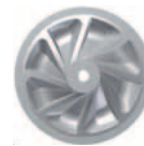
Csésze alakú járókerék