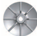
Járókerék sugár irányú lapátózással