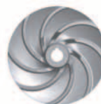
Járókerék ívelt lapátózással