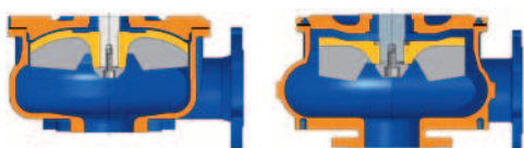
Íves járókerék profil WPA-B