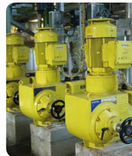
PRIMERROYAL®- műanyag alapanyag gyár