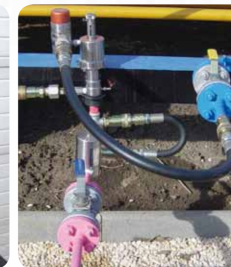
Földgáz kitermelés- Williams szivattyúk