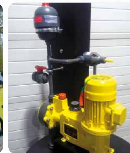
Citromsav adagoló állomás MAXROY® RA