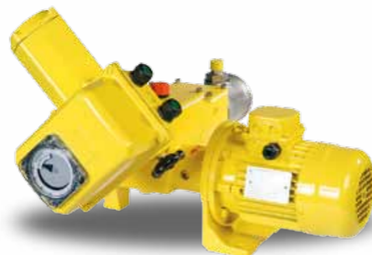
MILROYAL® D szervomotorral

PRIMERROY® K&L Q 16 - 3300 l/h P max 45 bar API 675