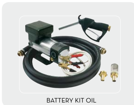
BATTERY KIT OIL