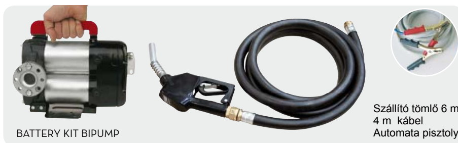
BATTERY KIT BIPUMP

Szállító tömlő 6 m 4 m kábel Automata pisztoly