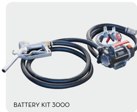
BATTERY KIT 3000