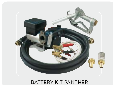
BATTERY KIT PANTHER