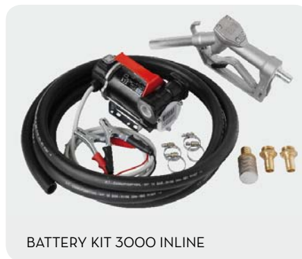
BATTERY KIT 3000 INLINE