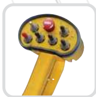
Kompakt kivitelű rádiós távvezérlő