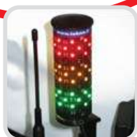
Audiovizuális figyelmeztető rendszer 90%-100% terhelési kapacitás elérésekor