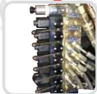
Szekcionált elektrohidraulikus vezérlőszелеp