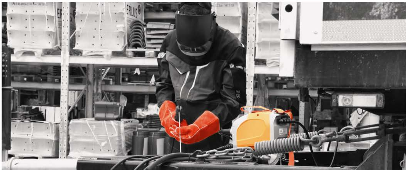
A BOOSTER2 javítási munkákban. Mindig megbízható és használatra kész.