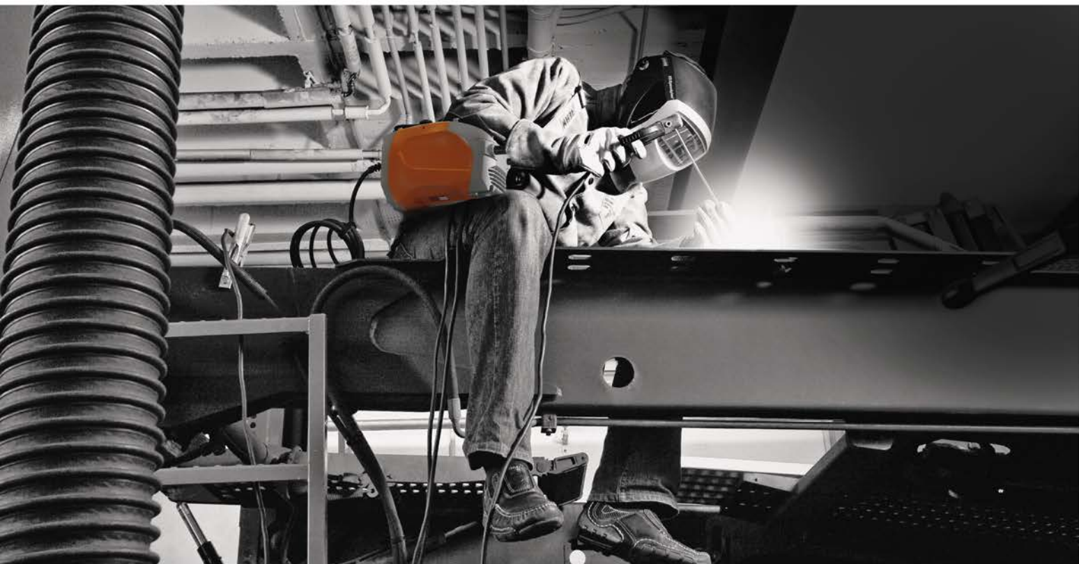
A BOOSTER2 acélszerkezet-gyártásban. Könnyen mozgatható, biztonságos kezelés, nagy teljesítmény.