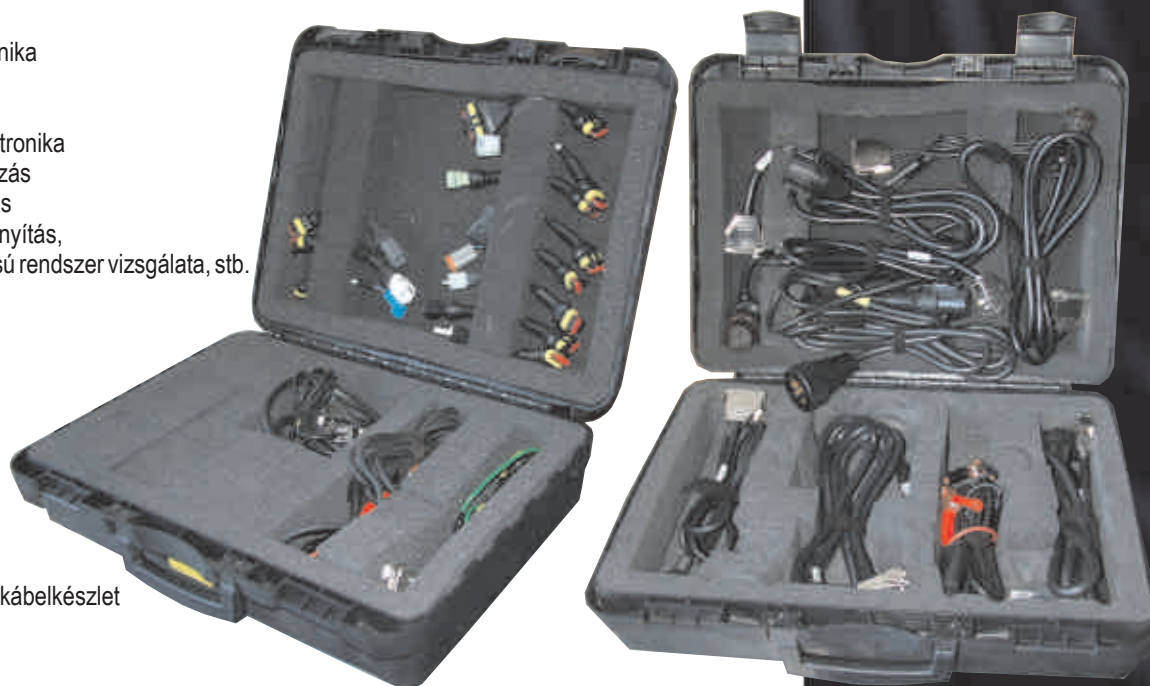
Trailer és teher kábelkészlet