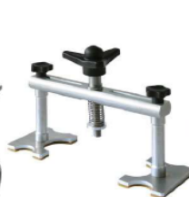
Alu Puller Réf: 051003