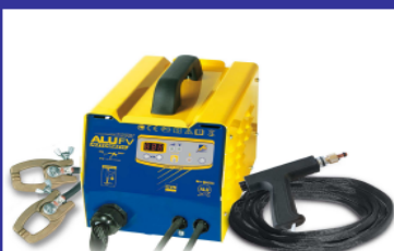
Alu Spot Réf: 051546