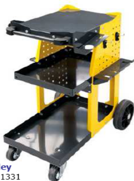
Trolley Réf: 051331