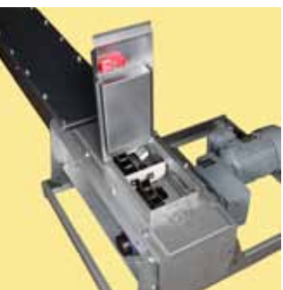
Torlódásgátló ajtó/szerelőnyílás biztonsági kapcsolóval.