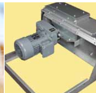
Közvetlen ráépítésű hajtómű motor tartóvázzal.