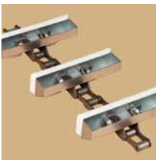
Rédler lánc visszatérő serlegekkel.

GALVANIZÁLT ENERGIATAKARÉKOS KÖNNYEN SZERVIZELHETŐ KOMPAKT MEGBÍZHATÓ KÖNNYEN ÖSSZESZERELHETŐ