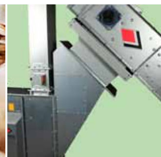
Csatlakozó garat a láncos szállító és a felvonó közt.