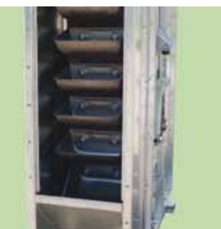
Antisztatikus serlegheveder acél serlegekkel.