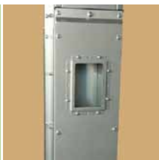
Ellenőrző nyílás kémlelő üveggel.

GALVANIZÁLT ENERGIATAKARÉKOS KÖNNYEN SZERVIZELHETŐ KOMPAKT MEGBÍZHATÓ KÖNNYEN ÖSSZESZERELHETŐ